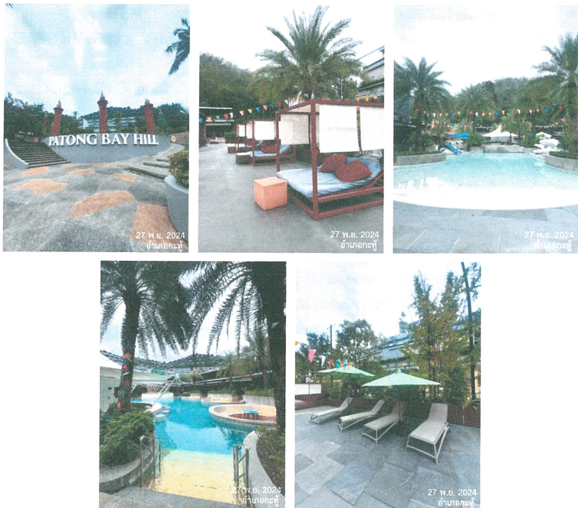
รูปภาพที่ 1.4 การใช้พื้นที่อาคาร