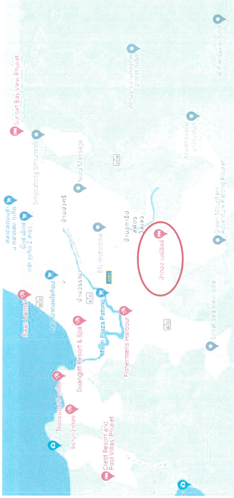
รูปภาพที่ 1.2 แผนที่ตั้งของโรงแรม ป่าตอง เบย์ อีลส์ รีสอร์ท ภูเก็ต