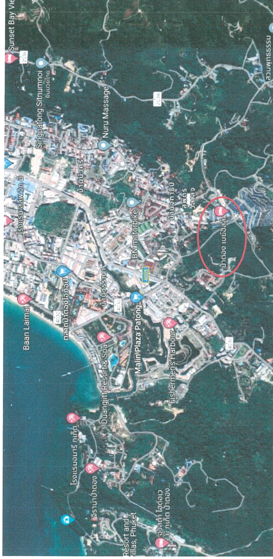
รูปภาพที่ 1.1 แผนที่ตั้งของโรงแรม ป่าตอง เบย์ อีลส์ รีสอร์ท ภูเก็ต (Top View)